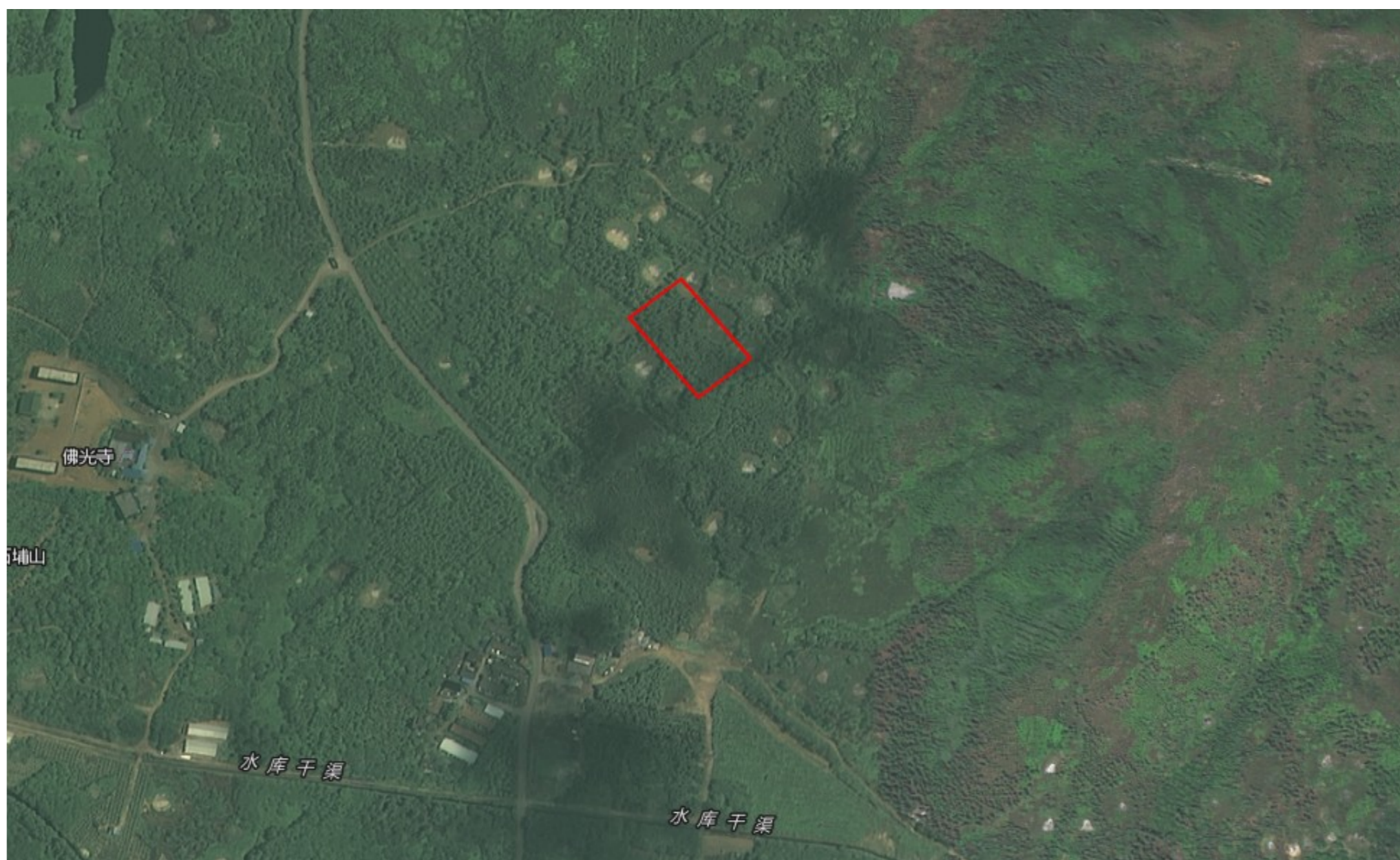
征地补偿安置公告附图